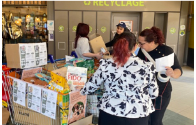
Affiche réalisée par les élèves de PL groupe B.

Pendant plusieurs mois, les élèves se sont investis avec beaucoup de sérieux et de cœur : collectes, démarches auprès des commerçants, recherche de lots pour la tombola du DogFest ... 100kg de croquettes, 10 kg de friandises, des jouets; de nombreuses boites de conserve, ainsi que des beaux lots pour la tombola du refuge de Roquebrune sur Argens, dont des produits Thalgo et un bon pour le restaurant de Roquebrune. Bravo aux élèves pour leur engagement.