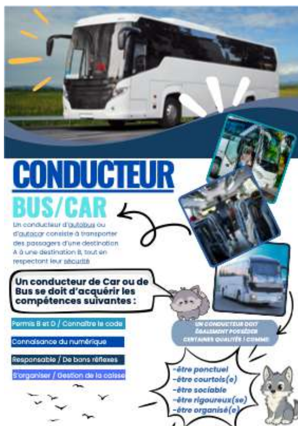
affiche réalisée par Maëlys.

Le CAP forme aux techniques de commercialisation de produits ou de services. Les enseignements donnent les connaissances sur les circuits de distribution, sur les modes d'approvisionnement, le stockage des marchandises. Les élèves sont formés à utiliser des documents commerciaux et à se servir de logiciels de caisse. Les enseignements en communication professionnelle permettent aux élèves d'être en capacité d'engager et de développer le contact avec la clientèle. www.onisep.fr